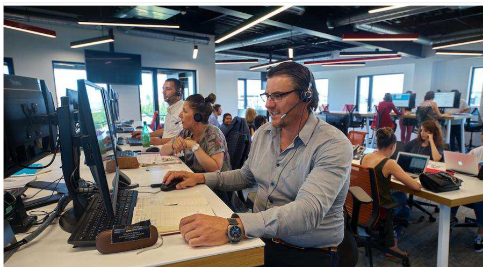
Plus que Pro fait partie du groupe Séréaliance aux multiactivités, dont des centres d'appels.

Comme les clients ont plutôt tendance à mettre en ligne leurs motifs d'insatisfaction, le travail des collaborateurs de Plus que PRO consiste à inciter le consommateur à faire l'effort d'exprimer son opinion satisfaite, en quelque sorte à valider une bonne e-reputation.