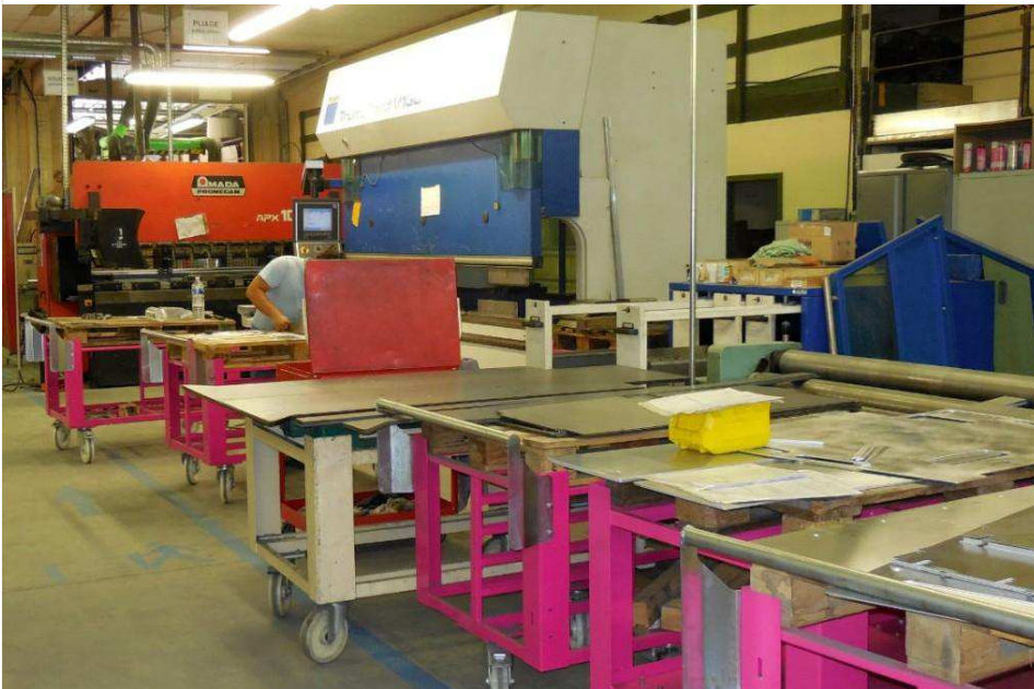
Alsace Tôlerie a réagi avec tact à un phénomène dont rêvent toutes les entreprises : la génération spontanée de clientèle, absolument pas planifiée.

Alsace Tôlerie ( /actualite/alsace-tolerie-34072 ) est récompensée pour le service de découpe en ligne pour les professionnels, baptisé John Steel Pro. Particulièrement présent en Alsace, dans les Vosges et le Territoire de Belfort, le spécialiste de la découpe laser, du pliage et la mécano-soudure implanté dans le Haut-Rhin, a lancé ce service sur mesure sur Internet il y a guère plus d'un an.