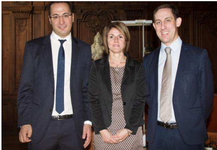
Les trois commissaires au compte qui ont prêté serment.

Sous la présidence de Bernard Bangratz, premier président de la cour d'appel de Besançon et en présence de Jean-Jacques Pichon, président de la compagnie régionale des commissaires aux comptes de Besançon, trois professionnels francs-comtois ont prêté serment le 29 octobre dernier.